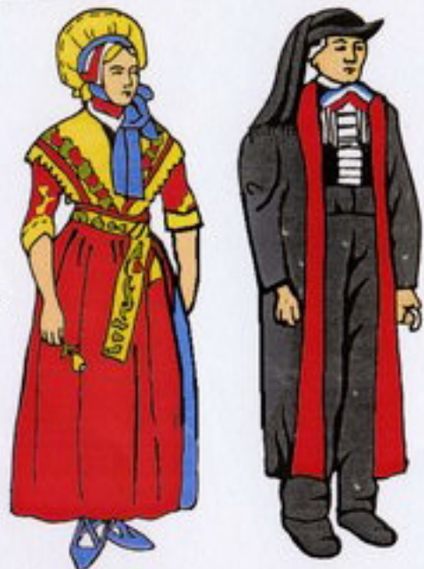
Trachten und Wappen von Nordrhein-Westfalen